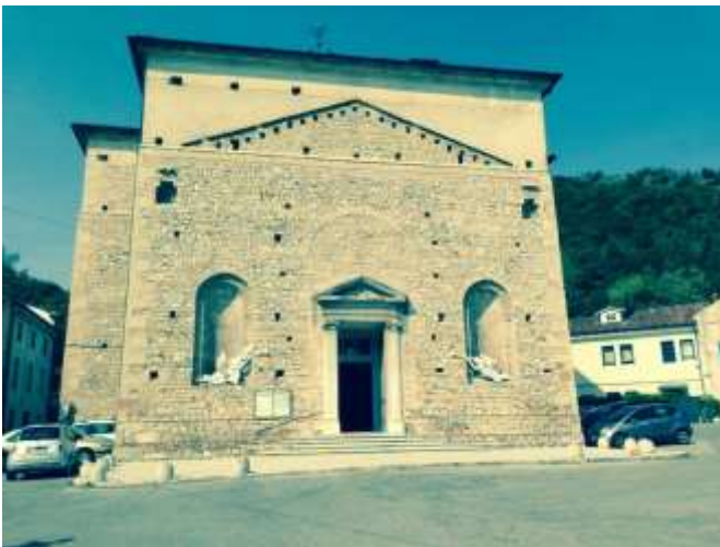
*Chiesa di Vittorio Veneto