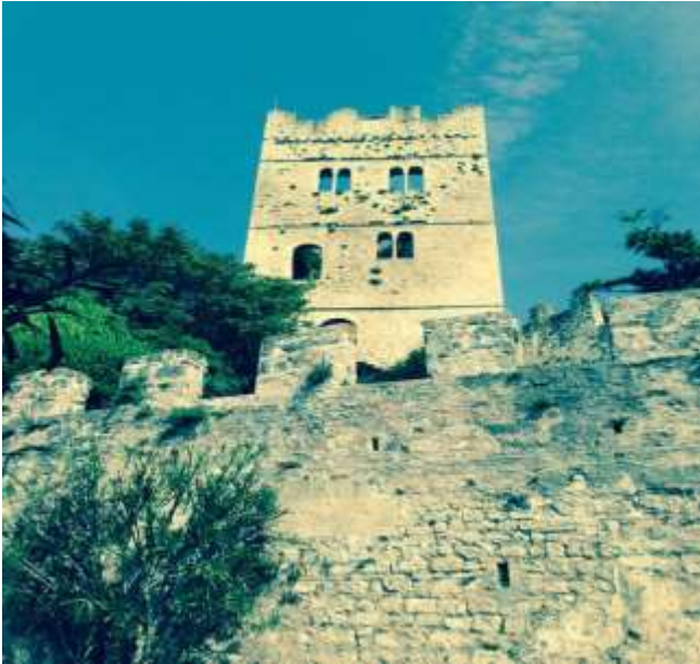
*Castello del Vescovo Vittorio